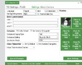
Anzeige der Kamerakonfiguration