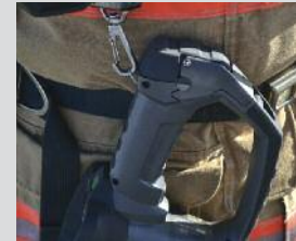
Drei Befestigungspunkte für Karabiner