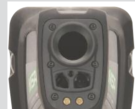
Vor Ort austauschbare Germaniumlinse