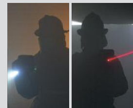
Blitzlicht / Laserpointer